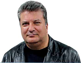
Momentos de Alicante Gerardo Muñoz

Nada más ocupar la ciudad de Alicante, las autoridades franquistas iniciaron las represalias contra todas aquellas personas que se opusieron al golpe de Estado. Además de castigar a los refugiados que habían sido confinados en los campos de concentración, comenzaron a buscar a quienes habían huido o se habían escondido. Tanto el fiscal militar como el Tribunal de Responsabilidades Políticas instaron con firmeza al Ayuntamiento para que colaborase en la recopilación de información sobre los dirigentes republicanos.