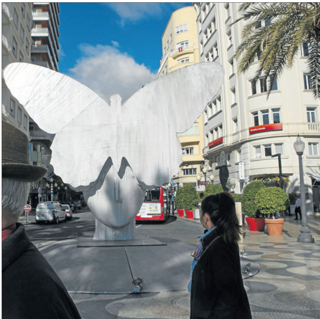
La escultura de la Mariposa, de Manolo Valdés, en la Explanada. RAFA ARJONES