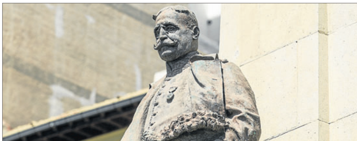
La obra en recuerdo de Canalejas, en la plaza del mismo nombre. ALEX DOMÍNGUEZ