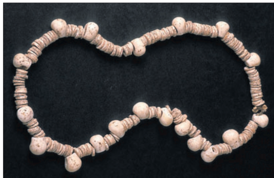
Collar de cuentas en caliza marmórea hallado en la Cova del Fum. MARQ