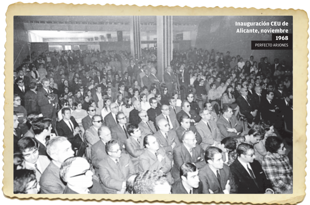
Inauguración CEU de Alicante, noviembre 1968

El día 18 es sentenciado a muerte el fundador de la Falange, José Antonio Primo de Rivera , y el día 20 es fusilado en la cárcel. El día 28 caen sobre la ciudad 160 bombas, produciendo terror y dolor, además de un gran incendio en los depósitos de CAMPSA. El día 29 se produce la saca de 52 falan-