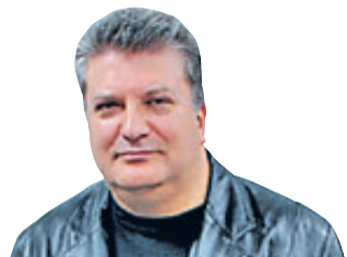
Momentos de Alicante Gerardo Muñoz Lorente

Año 1263 A lfonso X de Castilla concede el día 16 derecho de asilo a la iglesia de San Nicolás de la villa de Alicante, con excepción de los salteadores de caminos y profanadores de templos.