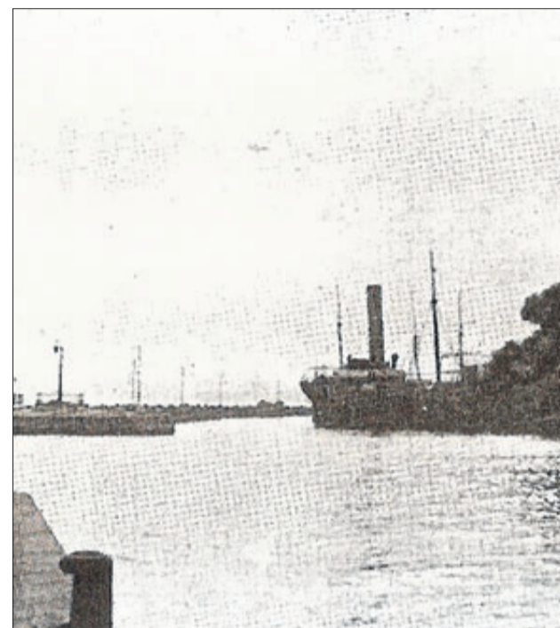
El Tiflis en los primeros momentos del incendio. INFORMACIÓN

Los heridos fueron trasladados al Club de Regatas, y desde allí fueron llevados a la Casa de Socorro o al retén que la Cruz Roja estableció rápidamente en la Plaza de Isabel II. El trabajador del muelle Antonio Campañ