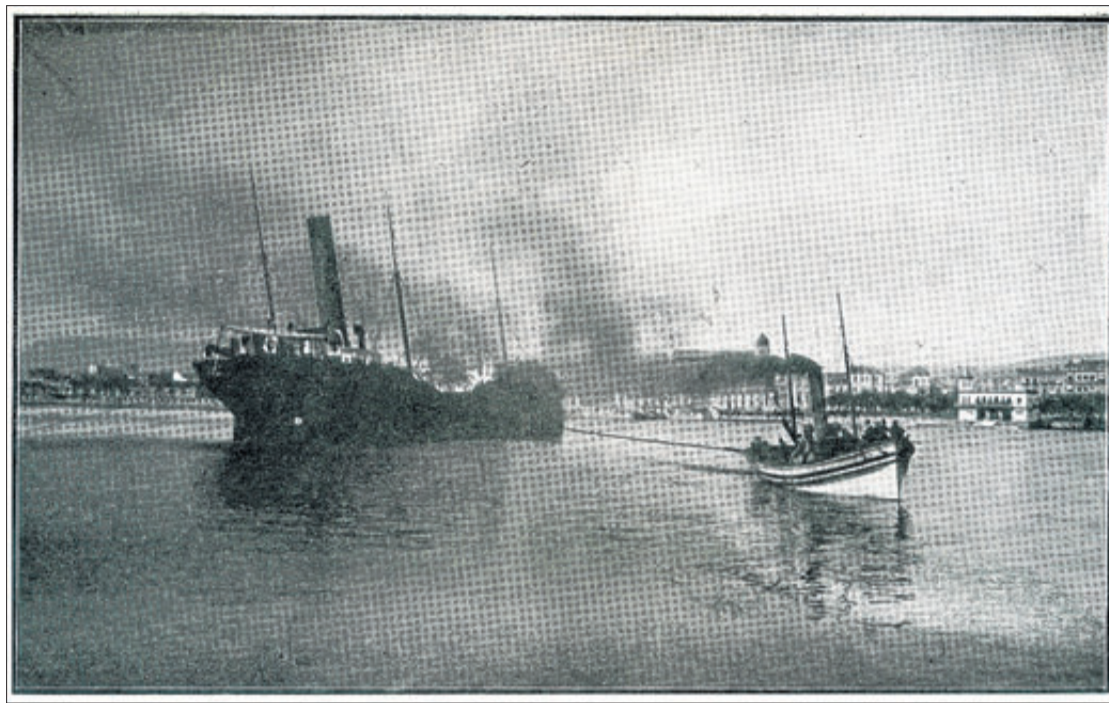
El Tiflis remolcado hacia el exterior del puerto por un pesquero. LA ACTUALIDAD

Gravina 13, y la tripulación en la posada Ramis.