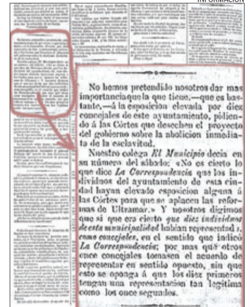
Página 2 de El Constitucional (29-1-1873), donde se confirma que 10 ediles alicantinos presentaron una exposición contraria a la abolición de la esclavitud en Puerto Rico.