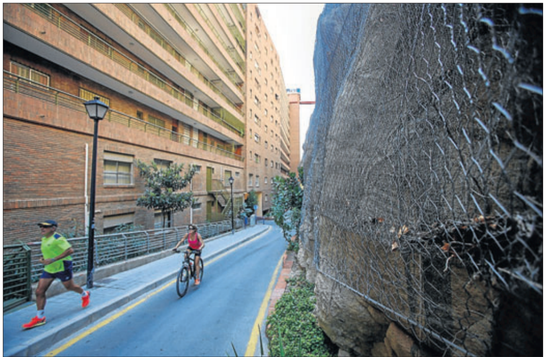
Imagen de la malla junto al edificio Rocafel, en la calle Sol Naciente. JOSE NAVARRO

www.gerardomunoz.com También puedes seguirme en www.curiosidario.es