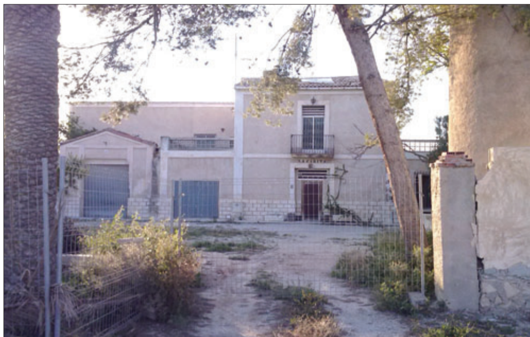
Casita Lozano, antes de su restauración.